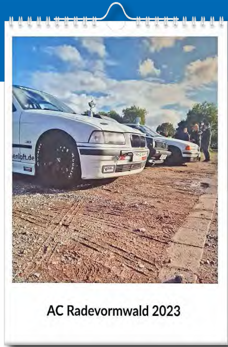
AC Radevormwald 2023